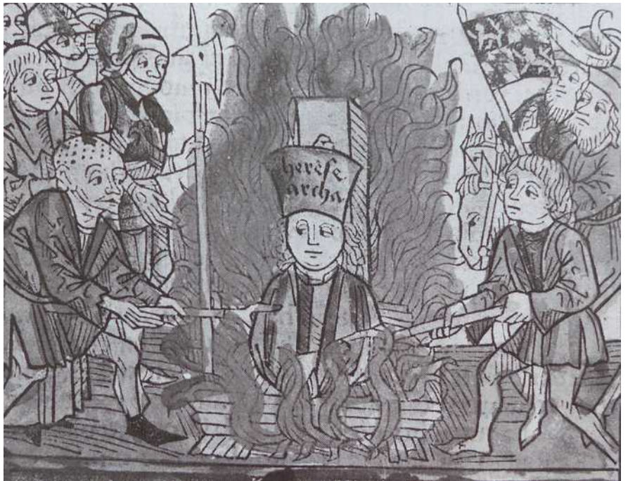
Jean Hus sur le bûcher. Gravure de 1483

recueillement profond, prières, simplicité, pauvreté, mission...sont ses valeurs.